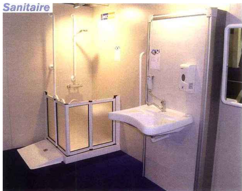
Douche avec rampe, receveur de douche adapté Sulby, parois de douche mi-hauteur et barre d'appui, lavabo motorisé.

Depuis cette date, le pôle Handic'aptitude a grandi et est devenu une partie intégrante du réseau Prolians. Il est géré depuis Lyon par une équipe animé par Jean-François Matéo qui assure une veille réglementaire et rencontre les fournisseurs pour trouver des solutions éco-