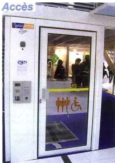
kit d'interphonie GH, porte automatique avec marquage adhésif des volumes verriers.

Sur Batimat, Descours & Cabaud présentait plusieurs exemples d'équipements conçus pour les personnes handicapées, dont ces trois espaces Accès, Accueil et Sanitaire.