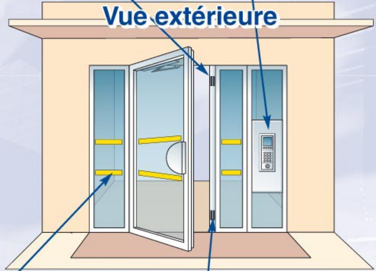
Vigivitre Dispositif adhésif de signalement