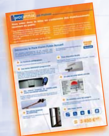
Les Packs Vision Futée