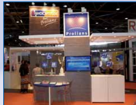
Le stand Handic'aptitude à Lyon

Ce salon a permis aux équipes d'Handic'aptitude de présenter les solutions de la gamme à des particuliers touchés par un handicap, premiers concernés l'accessibilité et le confort des bâtiments.