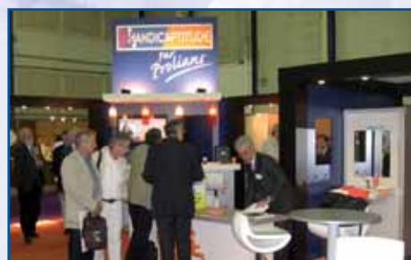
Le stand Handic'aptitude à Reims

La participation à ces deux événements de portée nationale représente une nouvelle étape dans la promotion du concept Handic'aptitude et une opportunité de rencontrer un public hétérogène de professionnels et de particuliers concernés par la problématique de l'accessibilité.