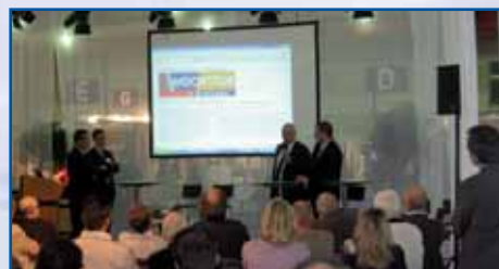
La signature du partenariat entre Prolians et l'Untec à Reims

La participation à ces deux événements de portée nationale représente une nouvelle étape dans la promotion du concept Handic'aptitude et une opportunité de rencontrer un public hétérogène de professionnels et de particuliers concernés par la problématique de l'accessibilité.